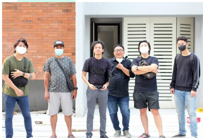
Gambar 2.3.1 Anggota DSI Architect & Partners