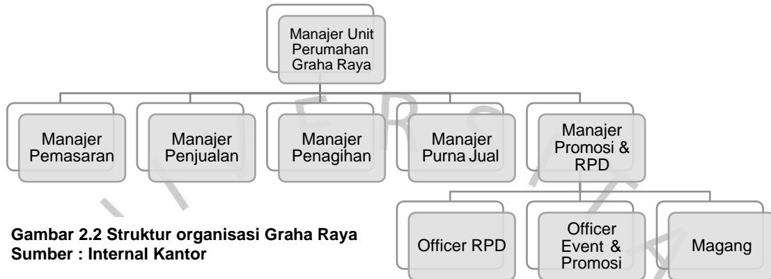
Gambar 2.2 Struktur organisasi Graha Raya

Berikut struktur organisasi unit perumahan Graha Raya :