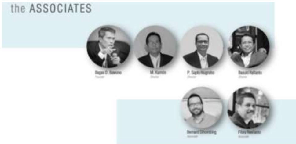
Gambar 2.3 Foto direksi PT.Bangun Gagas Karyatama