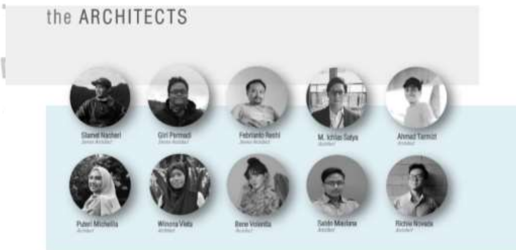
Gambar 2.4 Foto Arsitek PT.Bangun Gagas Karyatama