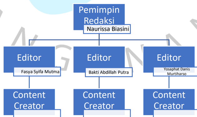
Gambar 2 Struktur Organisasi KOMPRESS Media

Dalam perusahaan memiliki struktur yang didalam terbagi menjadi beberapa divis sesuai dengan tugasnya masing-masing.