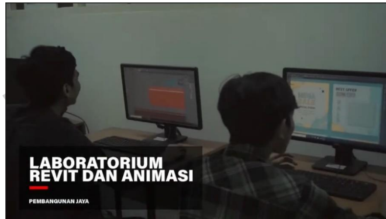
Gambar 3.4 Company Profile