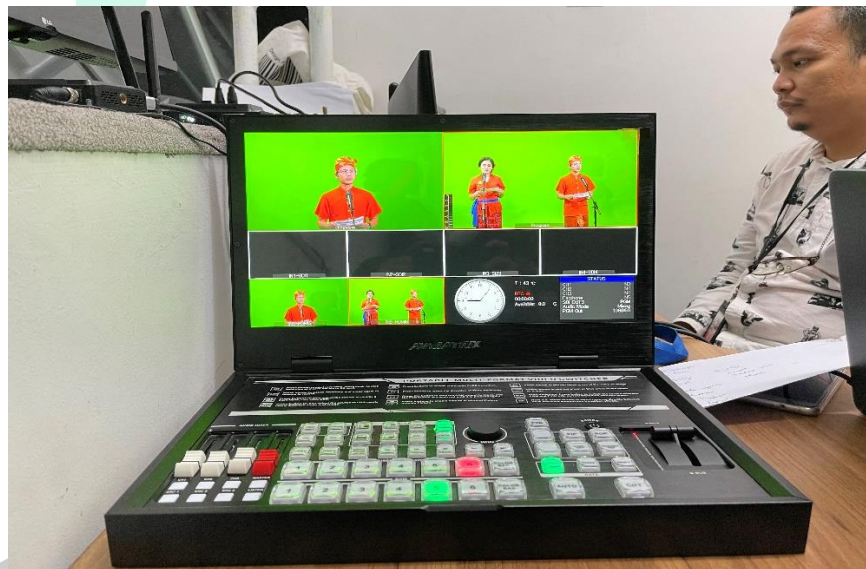
Gambar 3.3 Acara Dies Natalis ke-10 dan Wisudawan ke-7 Sarjana Universitas Pembangunan Jaya

Praktikan beserta tim UPJ LIVE turut serta dalam menjalankan acara Dies Natalis ke-10 dan Wisudawan ke-7 Sarjana Universitas Pembangunan Jaya. Kegiatan ini dilakukan di studio broadcasting Gedung A Universitas Pembangunan Jaya. Praktikan bertugas sebagai switcherman . Praktikan bertanggung jawab untuk pergantian gambar yang menyorot kedua MC (Master of Ceremony) secara bersamaan dan pergantian gambar yang berfokus pada satu MC