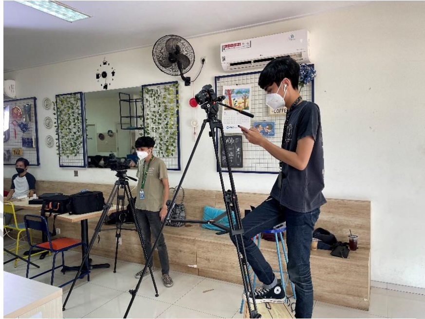
Gambar 3.2 Summer School

Pada kegiatan Summer School Praktikan beserta tim UPJ LIVE mendapatkan tugas untuk membuat sebuah video yang bertemakan kuliner yang melambangkan Indonesia atau ciri khas Indonesia. Pada kegiatan ini Praktikan bekerja sama dengan tim produksi untuk membuat video tersebut. Kemudian setelah proses produksi kegiatan tersebut telah selesai, praktikan melakukan editing video Summer School sesuai dengan konsep yang sudah ditentukan.