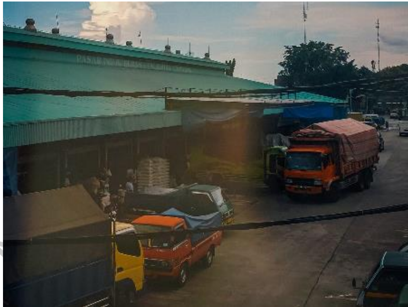
Gambar 4 Pasar Induk Beras Cipinang

Di samping itu Food Station juga menjalankan program sosial, sebagai bentuk kepedulian dan memenuhi kewajiban CSR (Corporate Social Responsibility), sesuai UU nomor 40 tahun 2007 tentang Pereraoan Terbatas. Kegiatan pengadaan beras dan barang jual lainnya Food Station melakukan kerjasama para produsen dan penggilingan beras, supaya mendukung program pemerintah dalam ketahanan pangan.