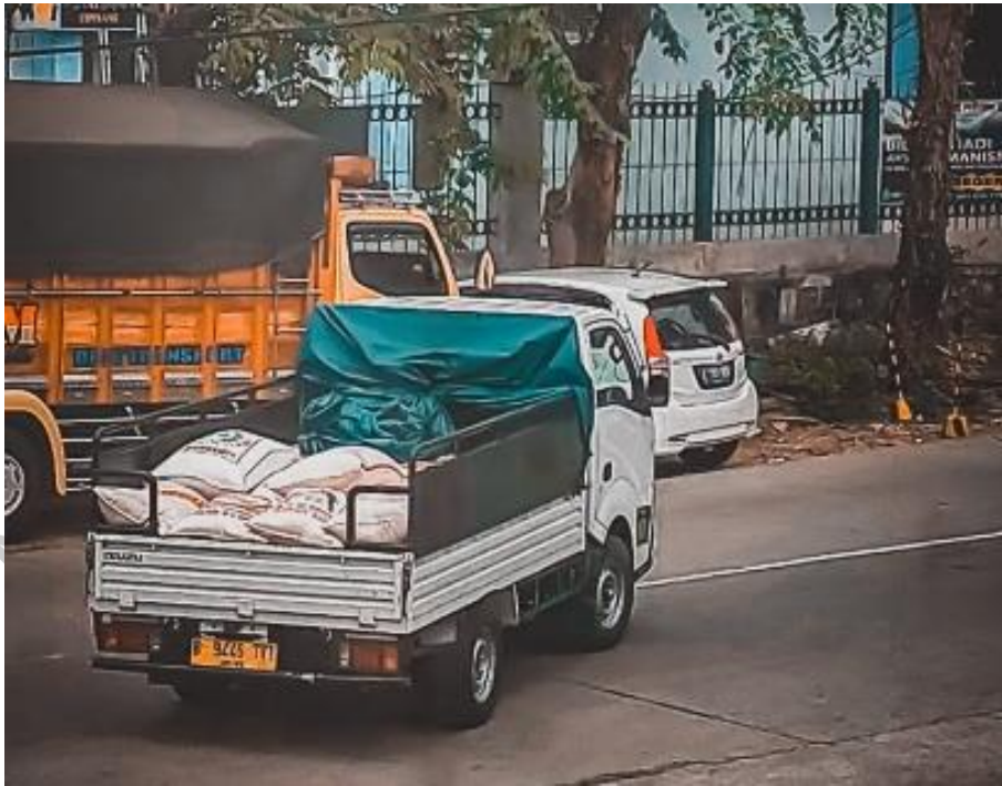
Gambar 5 Kegiatan pengiriman beras

Food Station akan menjadi penyangga stok dalam tata niaga beras, dan menjadi pusat informasi beras untuk jangkauan yang lebih luas. Memainkan peran lebih besar, kini Food Station telah menjadi pusat industri dan informasi bahan pangan Nasional. Membangun teknologi perdagangan pangan yang memungkinkan pengembangan standardisasi kualitas.