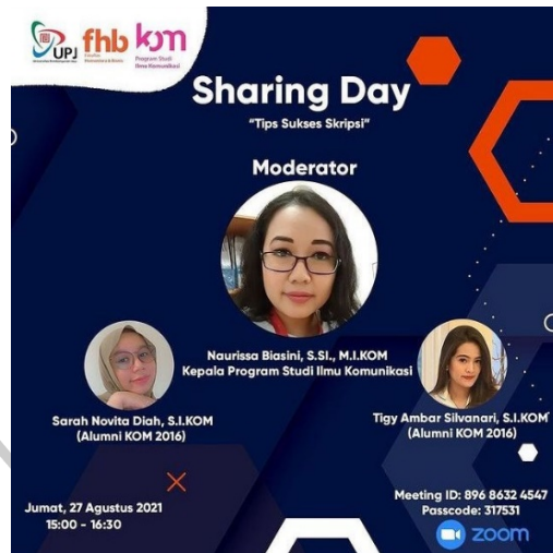
Gambar 2. 8 Poster Sharing Day "Tips Sukses Skripsi" (ilkom_upj, 2021)