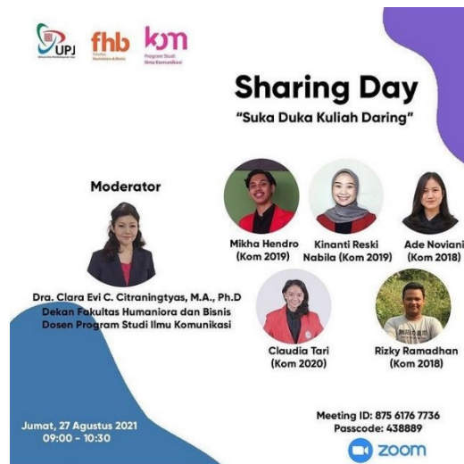
Gambar 2. 6 Poster Sharing Day "Suka Duka Kuliah Daring" (ilkom_upj, 2021)