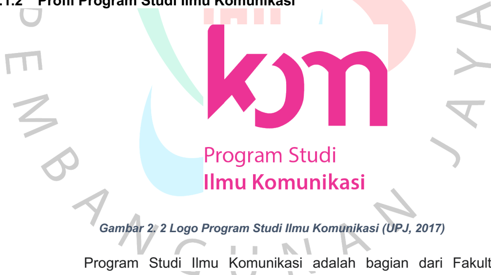
Gambar 2. 2 Logo Program Studi Ilmu Komunikasi (UPJ, 2017)

Program Studi Ilmu Komunikasi adalah bagian dari Fakultas Humaniora dan Bisnis sehingga visi, misi, serta tujuan dalam Program Studi Ilmu Komunikasi adalah hasil kristalisasi terhadap visi, misi, serta tujuan milik Fakultas Humaniora dan Bisnis yang di mana juga mengacu serta mendukung terhadap visi, misi, serta tujuan dari Universitas Pembangunan Jaya. Dalam penyusunan visi, misi, serta tujuan dari Program Studi Ilmu Komunikasi tentu juga terdapat pertimbangan opini serta berbagai masukan yang diperoleh dari berbagai pihak