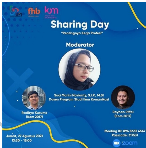
Gambar 2. 7 Poster Sharing Day "Pentingnya Kerja Profesi" (ilkom_upj, 2021)