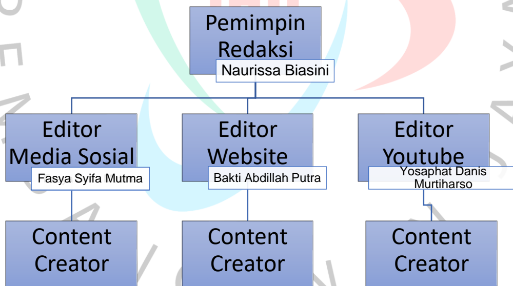
Gambar 2.2 Struktur Organisasi KOMPRESS