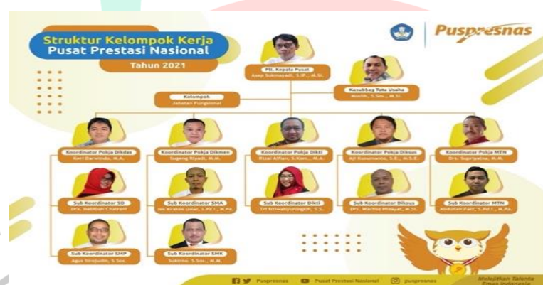
Gambar 2.2 Struktur Organisasi dan Kelompok Kerja Organisasi Pusat prestasi Nasional Kemdikbudristek RI (Struktur Organisasi Puspresnas, 2021)

Secara hierarki Pusat Prestasi Nasional adalah unit organisasi di bawah naungan Kemdikbudristek. Brand Puspresnas dibuat bukan untuk menyaingi Brand induknya yaitu Kemdikbudristek. Brand Puspresnas ditujukan untuk menguatkan dan mengendorse program-program kegiatan yang ada dibawah Puspresnas agar lebih mudah di komunikasikan dan memiliki image yang lebih sesuai dengan selera millenial yang menjadi stakeholder dari kegiatan Puspresnas (Struktur Organisasi Puspresnas, 2021). Kegiatan – kegiatan ini tentunya terbagi