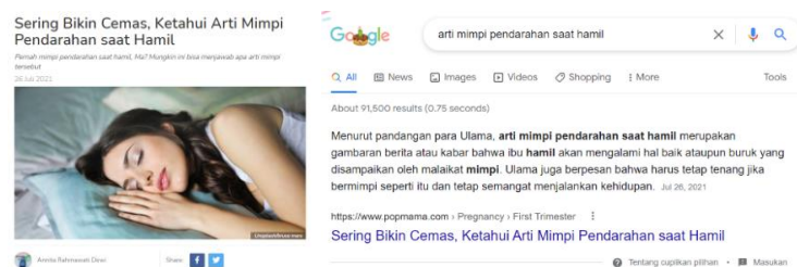
Gambar 3.3. Contoh Artikel SEO dan Hasil Pencarian di Google

Dari pelatihan tersebut, praktikan mencoba untuk mengikuti cara dan tips yang diberikan oleh IDN Times. Berikut ini adalah contoh artikel SEO yang praktikan kerjakan dengan judul “Sering Bikin Cemas, Ketahui Arti Mimpi pendarahan saat Hamil”. Praktikan sudah menggunakan kata kunci “arti mimpi pendarahan saat hamil” di dalam artikel untuk menerapkan SEO Friendly . Kemudian, praktikan juga meletakkannya dalam judul dan struktur URL. Selain itu, praktikan juga melakukan backlink dengan kategori Internal Link. Adapun ketika praktikan mencoba mencari dalam mesin pencari Google, artikel tersebut terdapat dalam urutan pertama dengan kata kunci pencarian “arti mimpi pendarahan saat hamil”. Kemudian, artikel ini mendapatkan jumlah pembaca 7.192 orang.