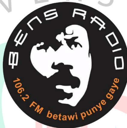
Gambar 2. 1 Logo Bens Radio