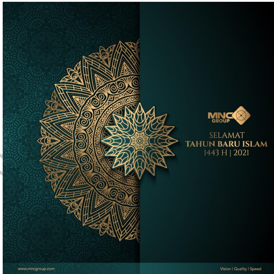
Gambar 2.7 Portofolio Perusahaan – Poster Ucapan Selamat Tahun Baru Islam