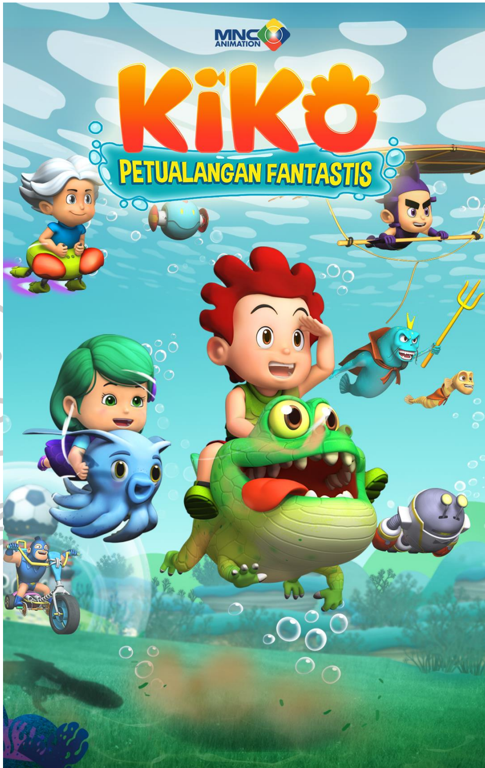
Gambar 2.8 Portofolio Perusahaan – Poster Animasi dari Kiko