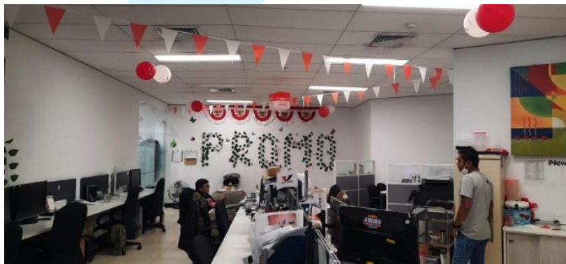
Gambar 2.4 Ruang Kerja (Fasilitas Perusahaan)