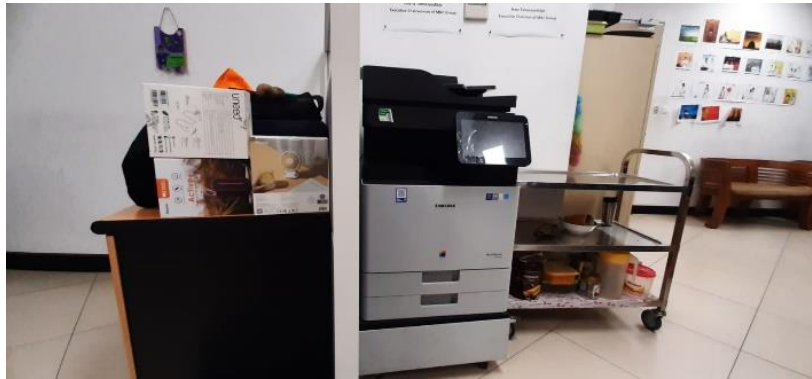
Gambar 2.5 Printer (Fasilitas Perusahaan)