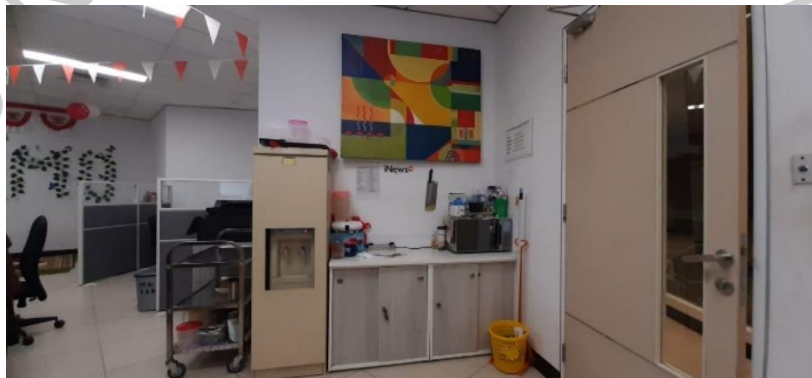
Gambar 2.6 Dapur (Fasilitas Perusahaan)