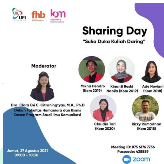
Gambar 2.3 Poster Acara Sharing Day oleh Program Studi Ilmu Komunikasi