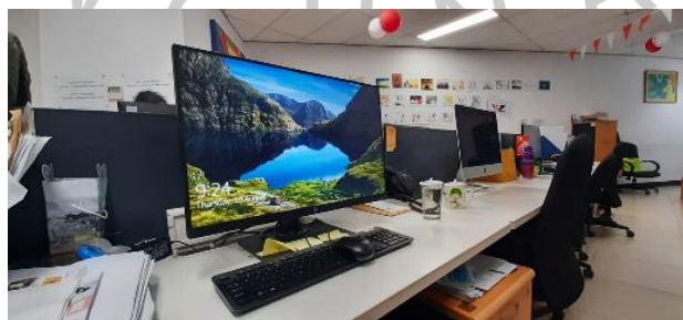
Gambar 2. 4 Komputer (Fasilitas Perusahaan)