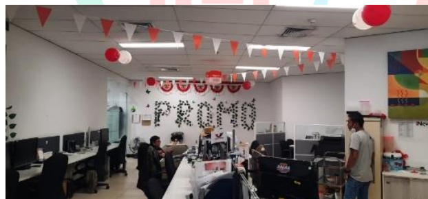
Gambar 2. 7 Ruang kerja (Fasilitas Perusahaan)