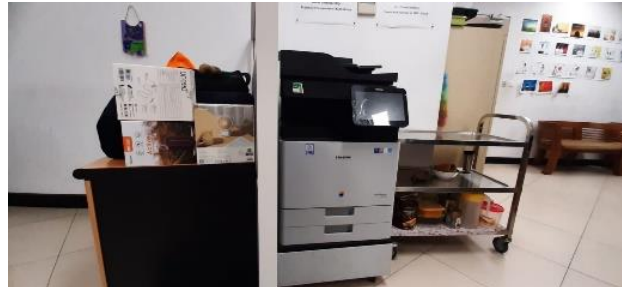
Gambar 2. 6 Printer (Fasilitas Perusahaan)