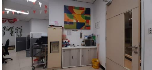
Gambar 2. 5 Dapur (Fasilitas Perusahaan)