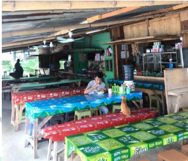
Gambar 1. 8 Kantin Proyek