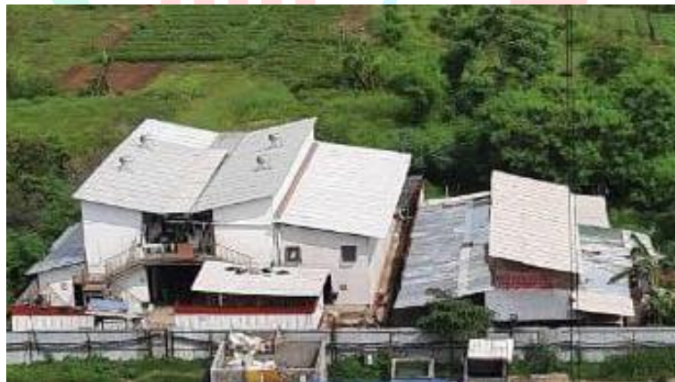
Gambar 1. 9 Mess Proyek

Area tempat singgah yang ditunjukkan pada Gambar 1.9 digunakan para pekerja untuk menetap sementara selama proyek berlangsung.