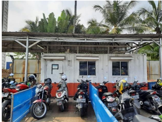
Gambar 1. 6 Ruang Medis