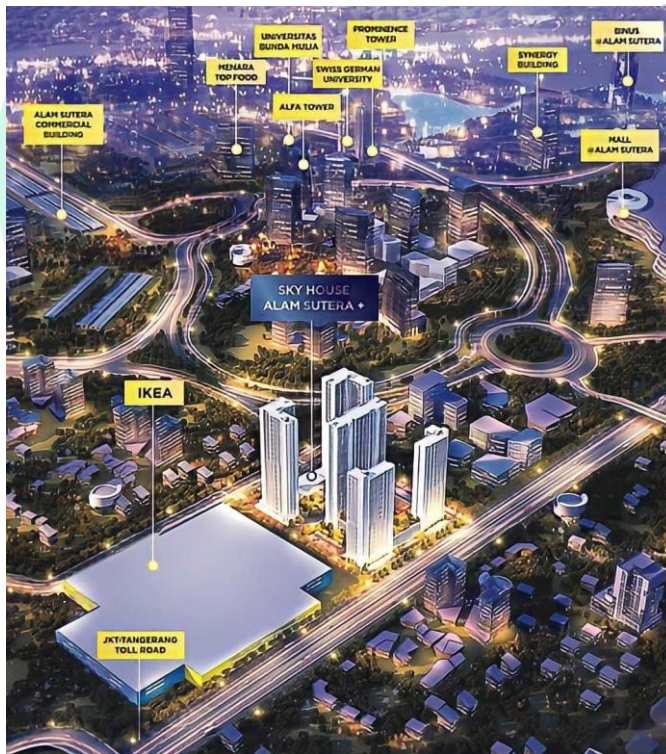
Gambar 1. 1 Lokasi Proyek Sky House Alam Sutera+ ( www.skyhousealamsutera.co )