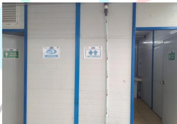
Gambar 1. 5 Toilet Proyek

Toilet yang difasilitasi untuk staf dan pekerja. Visualisasi toilet yang terdapat dalam proyek Sky House Alam Sutera terlihat dalam Gambar 1.5