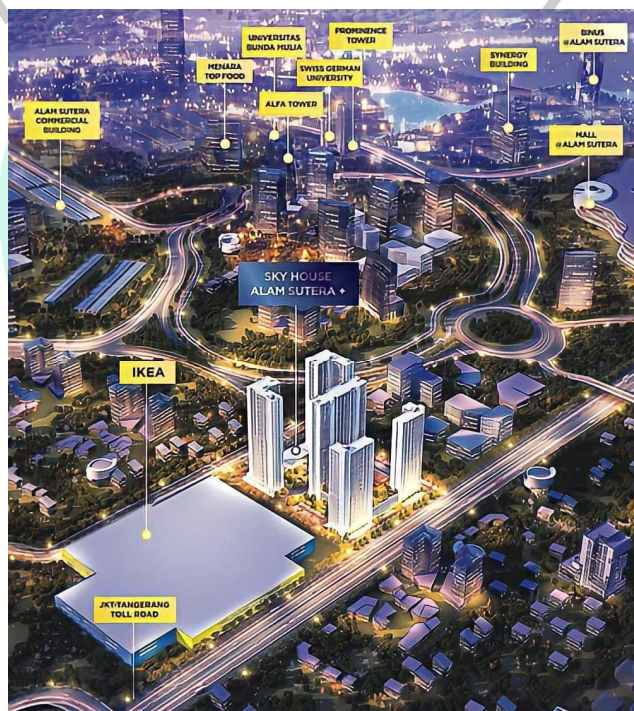
Gambar 1. 1 Lokasi Proyek Sky House Alam Sutera+ ( www.skyhousealamsutera.co )