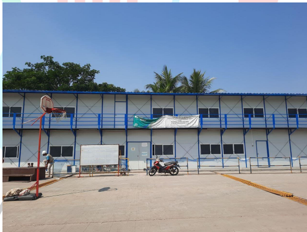
Gambar 1. 3 Kantor Proyek

Kantor proyek yang tercantum pada Gambar 1.3 merupakan kantor yang bersifat sementara untuk kontraktor, pemilik proyek, maupun konsultan yang bertujuan mempermudah inspeksi ataupun pelaksanaan pembangunan proyek itu sendiri.