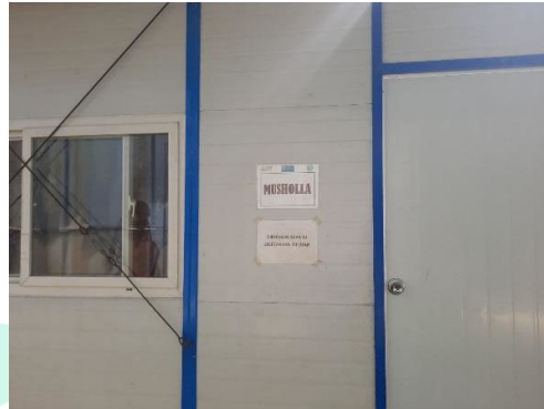
Gambar 1. 4 Musala Proyek

Musala yang terdapat didalam proyek diwujudkan dalam Gambar 1.4 Merupakan tempat beribadah bagi staf dan pekerja proyek yang beragama Islam.