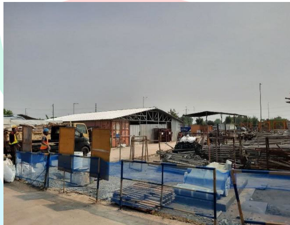
Gambar 1. 7 Gudang Proyek

Gudang yang tercantum pada Gambar 1.7 Merupakan tempat yang dipergunakan untuk menyimpan material-material proyek yang digunakan.