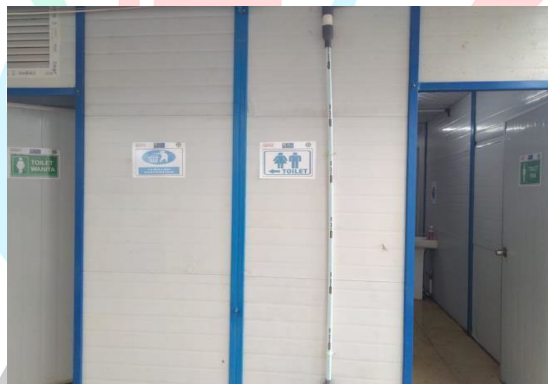
Gambar 1. 5 Toilet Proyek

Toilet yang difasilitasi untuk staf dan pekerja. Visualisasi toilet yang terdapat dalam proyek Sky House Alam Sutera terlihat dalam Gambar 1.5