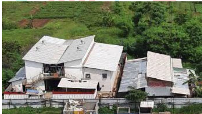
Gambar 1. 9 Mess Proyek

Area tempat singgah yang ditunjukkan pada Gambar 1.9 digunakan para pekerja untuk menetap sementara selama proyek berlangsung.