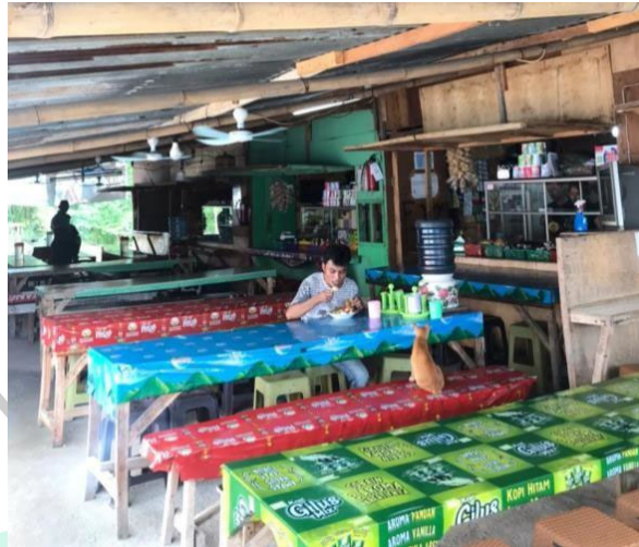
Gambar 1. 8 Kantin Proyek