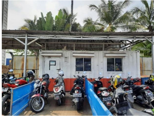
Gambar 1. 6 Ruang Medis