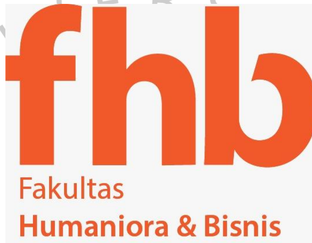
Gambar 2.1 Logo Fakultas Humaniora dan Bisnis

Fakultas Humaniora dan Bisnis (FHB), Universitas Pembangunan Jaya pertama kali berdiri pada tahun 2011. Tetapi fakultas ini baru beroperasi pada tahun 2013, di mana pendaftaran mahasiswa baru pertama kali dibuka. Dalam FHB terdapat empat Program Studi yaitu, Ilmu Komunikasi, Psikologi, Manajemen, dan Akuntansi. Dari keempat Program Studi yang berada dalam lingkup FHB, jumlah mahasiswa Ilmu Komunikasi selalu mendominasi dari program studi lainnya yang ada di Universitas Pembangunan Jaya (Kompres, 2021).