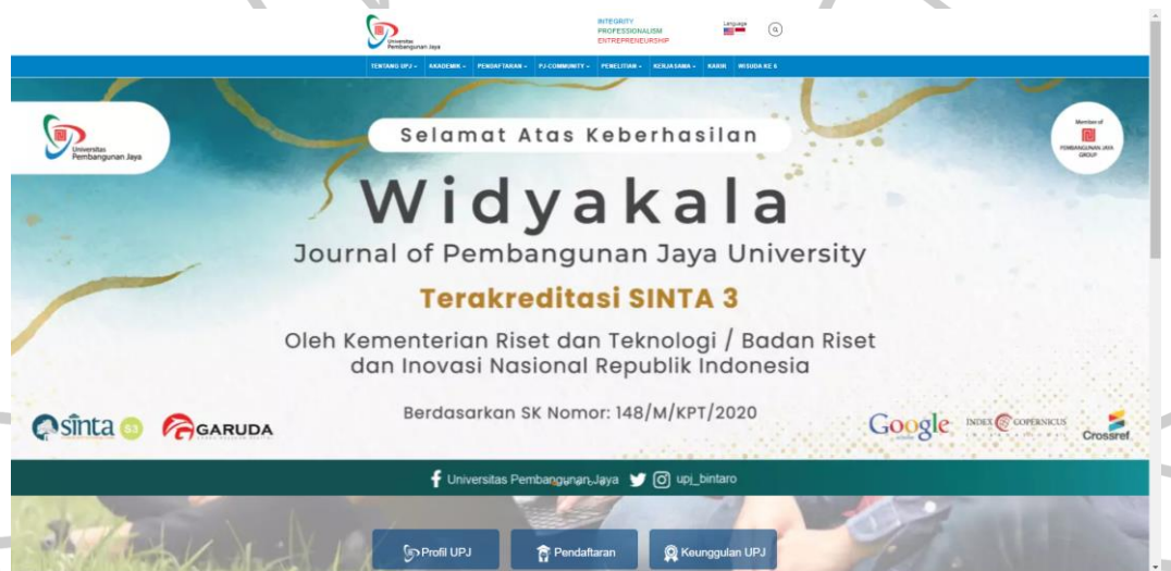
Gambar 2. 1 Website UPJ ( upj.ac.id , 2021)

Selain aplikasi di atas, Bagian ICT UPJ juga mengembangkan sebuah website berisi berbagai informasi yang dapat diakses oleh semua orang. Terdapat berbagai macam hal yang dibahas di web ini seperti sejarah UPJ, visi misi UPJ, fakultas yang ada di UPJ, penelitian yang dilakukan UPJ, pengabdian masyarakat, informasi acara terbaru, dan lain sebagainya. Website UPJ dirancang dan di-publish pada tahun 2011 dan akan terus dikembangkan hingga saat ini.