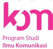
Gambar 2. 2 Logo Program Studi Ilmu Komunikasi