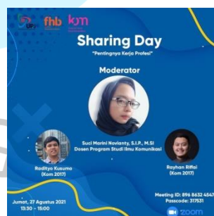
Gambar 2. 7 Poster Acara Kompress Sharing Day "Pentingnya Kerja Profesi"