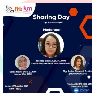
Gambar 2. 8 Poster Acara Kompress Sharing Day "Tips Sukses Skripsi"