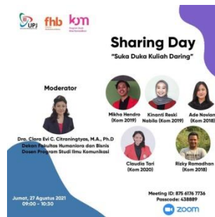
Gambar 2. 6 Poster Acara Kompress Sharing Day 1 "Suka Duka Kuliah Daring"