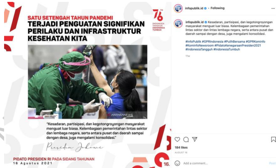
Gambar 3.3 Template Rapat Tahunan Ipid

ornamenornamen seperti foto Presiden untuk menjadi background template tersebut.