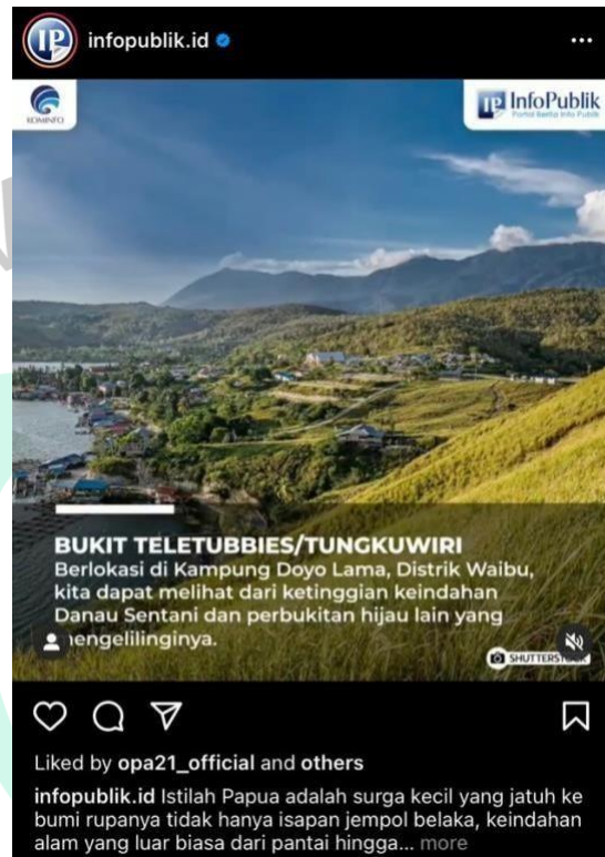
Gambar 3.2 Screenshot Video Infografis

praktikan jelaskan terlebih dahulu, bahwa dalam hal pembuatan konten video, portal berita Infopublik.id dan Indonesia.go.id tergabung menjadi satu.