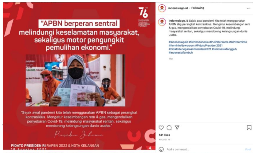
Gambar 3.4 Template Rapat Tahunan Igid