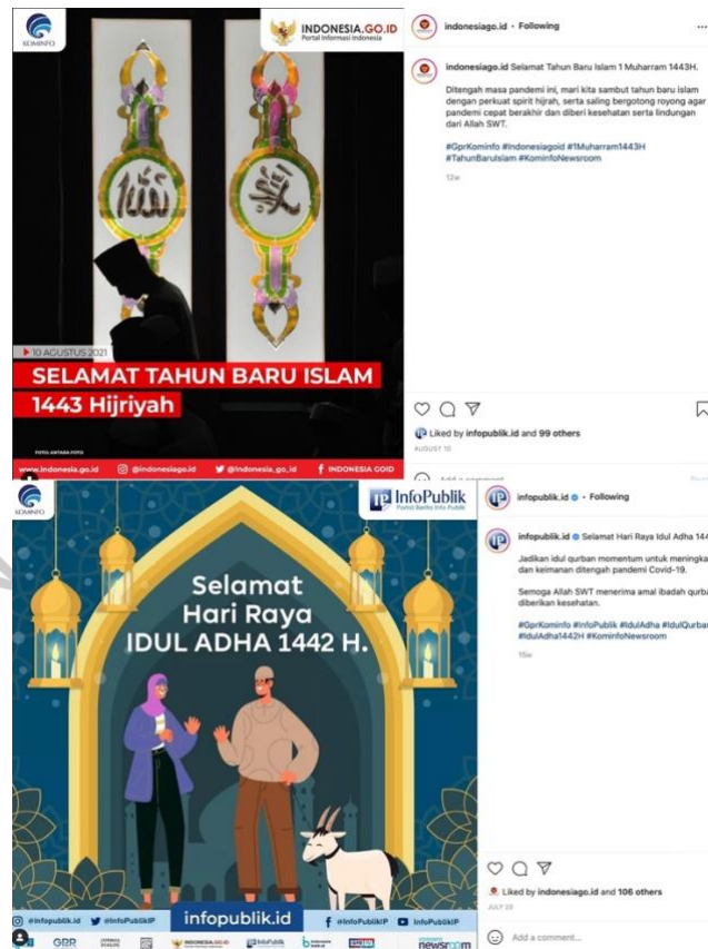
Gambar 3.5 Template Animasi Ipid & Igid