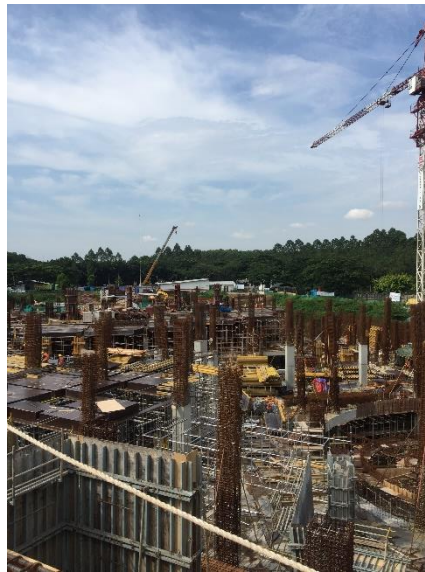
Gambar 1.2 Batas Utara : Taman BXC Mall

Adapun batas – batas geografi dari bangunan tersebut adalah: