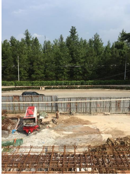
Gambar 1.3 Batas Timur : Jalan Toll Jakarta – Serpong