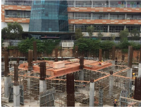
Gambar 1.5 Batas Barat : Gedung BXC Mall 1