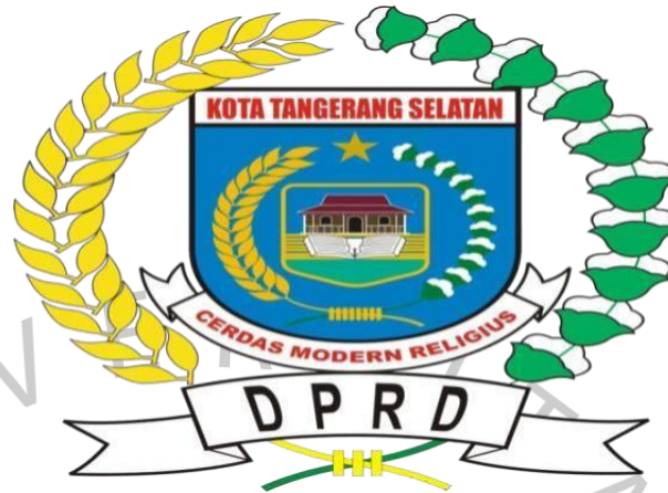
Gambar 1. 1 Logo Sekretariat DPRD kota Tangerang Selatan.