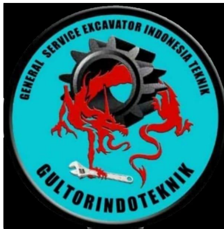
Gambar 2.1 Logo PT. Gultor Indo Teknik

Logo merupakan identitas dari suatu perusahaan yang mencerminkan dari visi dan misi perusahaan tersebut yang berbentuk visual. Logo dapat disebut juga simbol perusahaan tersebut yang berfungsi sebagai identitas dan sebagai ciri khas perusahaan. Berikut adalah logo perusahaan PT. Gultor Indo Teknik.