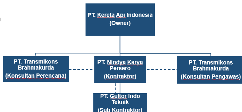
Gambar 2.3 Alur Komunikasi dan Koordinasi Proyek Pembangunan (JGBC.01) Jalur Ganda Bogor-Ciomas-Sukabumi

Pada sub bab ini menggambarkan struktur organisasi pada proyek pembangunan KA STA. 4+200 s/d 6+800 (JGBC. 01) Jalur Ganda Bogor – Ciomas – Sukabumi, serta tugas dan wewenang setiap badan atau perorangan dalam proyek tersebut.