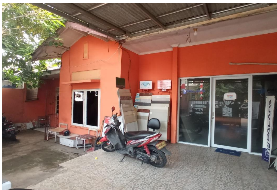
Gambar 1. 1 Kantor PT. PALAPA KERAMIK GRANIT

Gambar di atas adalah tempat Kerja Profesi Praktikan dimana Praktikan melakukan segala aktivitas selama menjalankan program Kerja Profesi. Tetapi, tempat Kerja Profesi Praktikan tidak hanya berada di tempat tersebut. Beberapa tugas-tugas yang diberikan perusahaan kepada Praktikan mengharuskan Praktikan menjalankan aktivitas selama program Kerja Profesi harus secara langsung sehingga tempat Kerja Profesi Praktikan tidak hanya berada pada tempat yang ada pada gambar di atas.