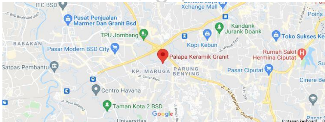
Gambar 1. 3 Lokasi Peta Kantor PT. PALAPA KERAMIK GRANIT

Berikut adalah foto ruang kerja di saat Praktikan menjalankan program Kerja Profesi. Ruang kerja tersebut menjadi tempat dimana Praktikan melakukan beberapa tugas yang diberikan perusahaan selama program Kerja Profesi berlangsung.