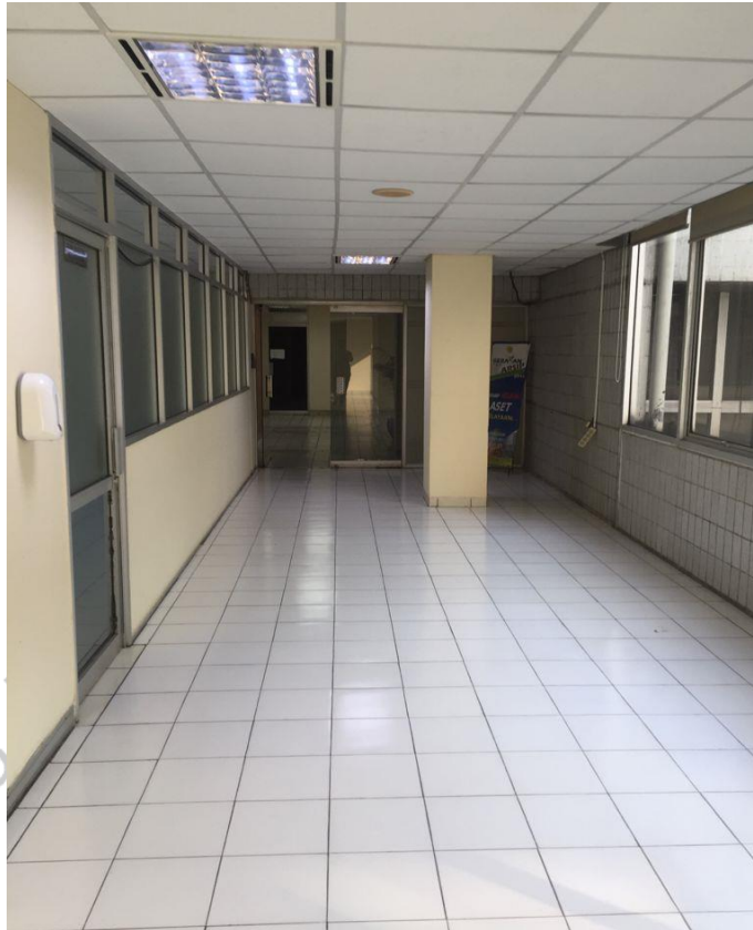
Gambar 1. 2 ruangan gedung D