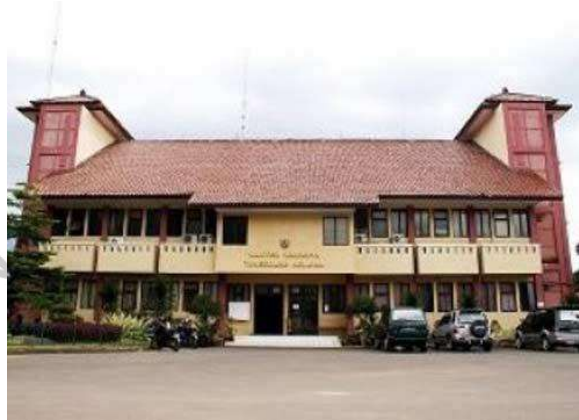
2.1 Gambar Kantor Lama Walikota Tangerang Selatan

Kantor walikota Tangerang Selatan saat ini bertempat di Jl. Maruga No. 1, Kelurahan Serua, Kecamatan Ciputat, Kota Tangerang Selatan, Banten. Balaikota Tangsel mulai ditempati tanggal 25 November 2015. Dalam undang-undang nomor 51 tahun 2008 tentang pembentukan Ibukota Tangsel yang dijelaskan bahwa berada di daerah Kecamatan Ciputat. Sejak didirikan, kantor walikotal untuk sementara berada di kantor Kecamatan Pamulang yang berada di Jl. Siliwangi No.1, Kelurahan Pamulang Barat. Sejak tahun 2013 kantor walikota ini pernah dipindah ke tempat milik Kementerian Perumahan Rakyat di Kecamatan Setu. Hal ini disebabkan kaena kantor kecamatan Pamulang saat itu sedang renovasi.