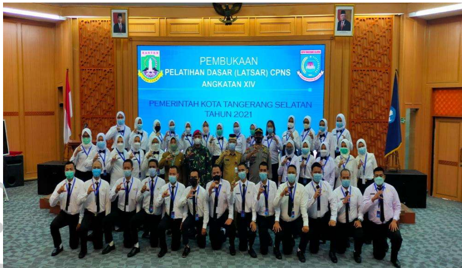
2.5 Kegiatan Bidang Diklat

pendidikan dan pelatihan maka akan meningkatnya kualitas sumberdaya yang dimiliki. Dalam sebuah organisasi perlu memiliki sumberdaya yang berkualitas untuk mencapai target tujuan organisasi itu sendiri.