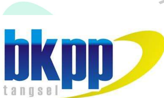
2.3 Gambar Logo BKPP

BKPP adalah pendukung dalam pelaksanaan kegiatan Pemerintahan Daerah di bagian Kepegawaian, Pendidikan dan Pelatihan. BKPP diketuai oleh kepala bidang yang memiliki tanggung jawab langsung kepada Walikota dan Sekretaris Daerah. Kegiatan umum pada bidang BKPP adalah mengurus semua urusan yang mempunyai kaitan dengan sumber daya manusia yaitu aparatur sipil negara pada daerah Kota Tangerang Selatan. BKPP memiliki peranan penting dalam membantu tugas pemerintahan Kota Tangerang Selatan. Dalam ini BKPP membawahi tiga bagian yaitu Pendayagunaan, Mutasi dan Pendidikan dan Pelatihan (diklat)