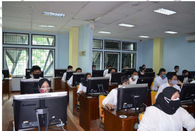
2.4 Foto Kegiatan Ujian CPNS

Kegiatan umum pada bidang pendayagunaan adalah pengadaan formasi untuk aparatur sipil Negara Kota Tangerang Selatan yang baru, dikarenakan adanya tahapan pensiun dan mutasi maka diperlukan pengganti. Pegawai pengganti ini diseleksi melalui tahapan-tahapan hingga akhirnya lulus ujian. Kegiatan Proses ini dinamakan perekrutan calon pegawai negeri sipil (cpns) Kota Tangerang Selatan. Kegiatan cpns ini atas dasar persetujuan dan arahan dari Badan Kepegawaian Negara (BKN).