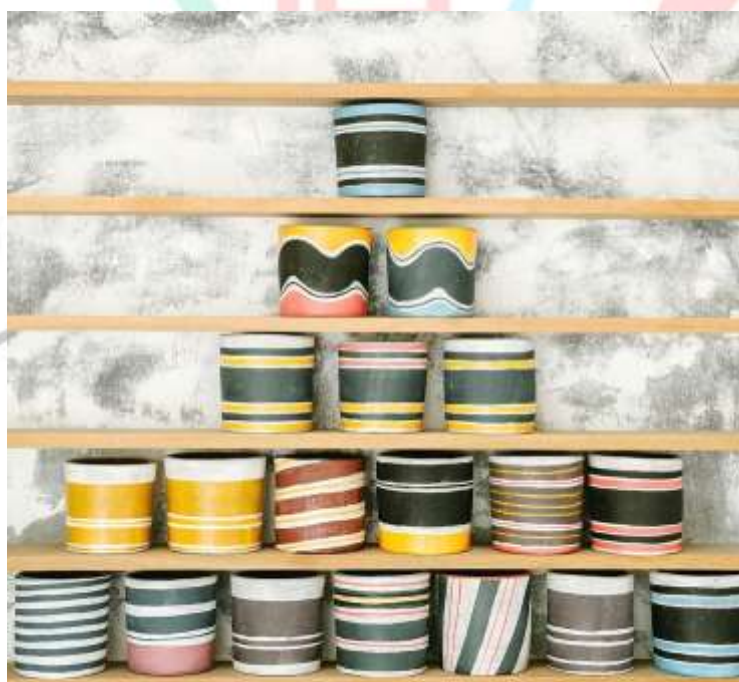
Gambar 2.17 Pot Lukis