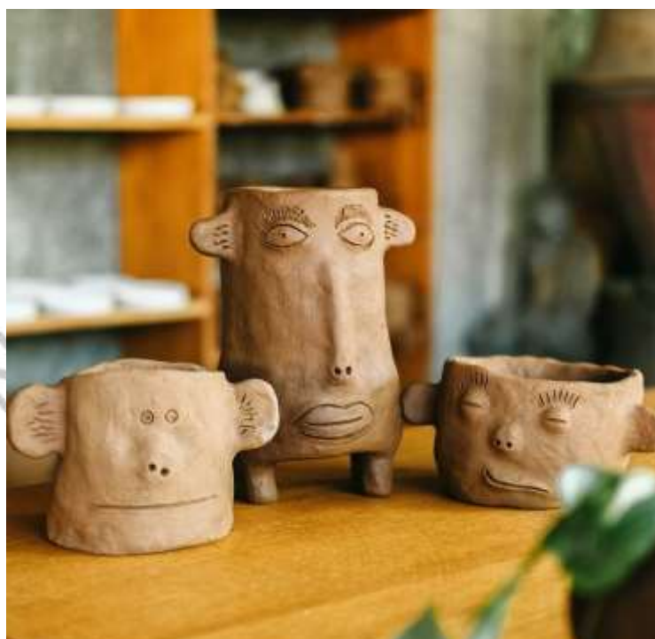
Gambar 2.16 Pot Wajah