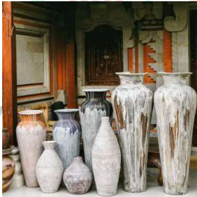
Gambar 2.15 Vase Besar