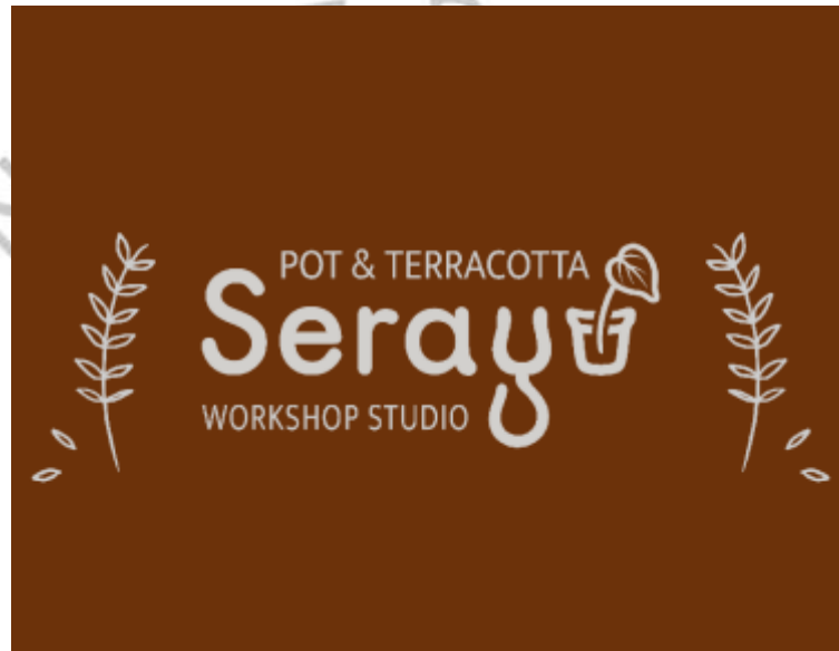
Gambar 2.1 Logo Serayu