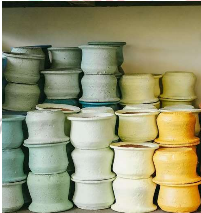
Gambar 2.13 Pot Warna