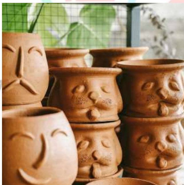
Gambar 2.9 Pot Wajah Hewan