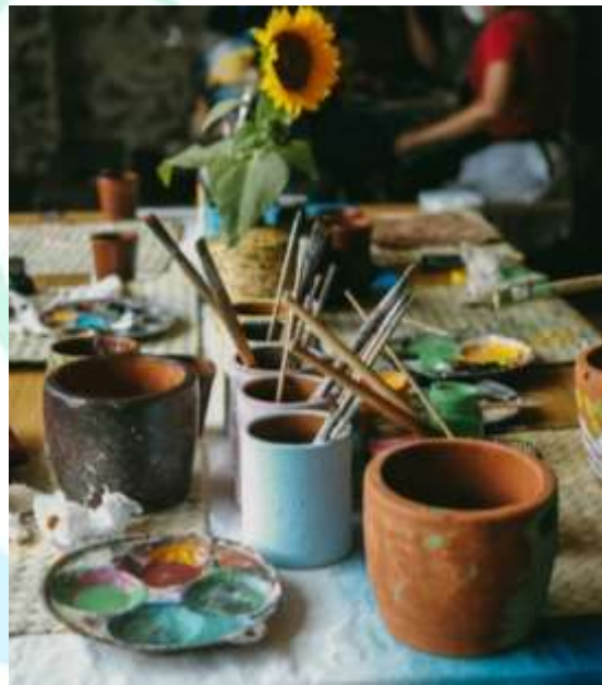
Gambar 2.4 Persiapan Workshop Drawing

Dalam mengikuti kelas yang diadakan oleh Serayu peserta harus mendaftar secara online di website yang tercantum di instagram serayu untuk menentukan kelas yang ingin diikuti dan tanggal pelaksanaannya, saat pelaksanaan kelas atau workshop peserta akan mendapatkan waktu 90 menit untuk melukis ataupun membuat tembikar, dalam kelas melukis peserta akan mendapatkan 2 pot sedangkan dalam kelas pottery peserta akan mendapatkan 2kg tanah earthenware atau stoneware sesuai kelas yang diikuti, dalam kelas melukis peserta dapat langsung membawa karya yang di buat, sedangkan dalam kelas pottery peserta harus menunggu selama 7-10 hari untuk tanah earthenware dan untuk tanah stoneware 10-14 hari untuk dapat dibawa pulang.