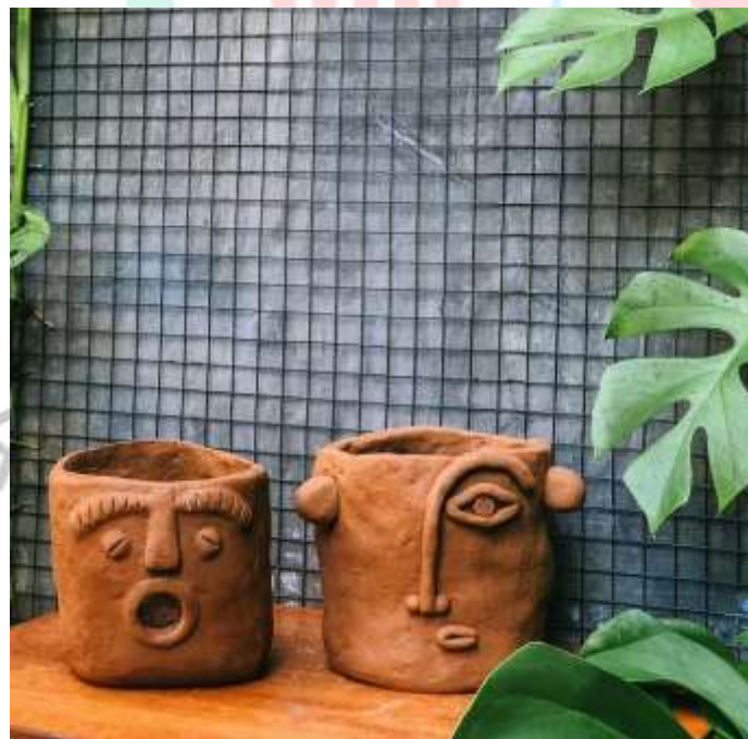
Gambar 2.7 Pot Funky Face