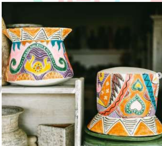
Gambar 2.11 Pot lukis