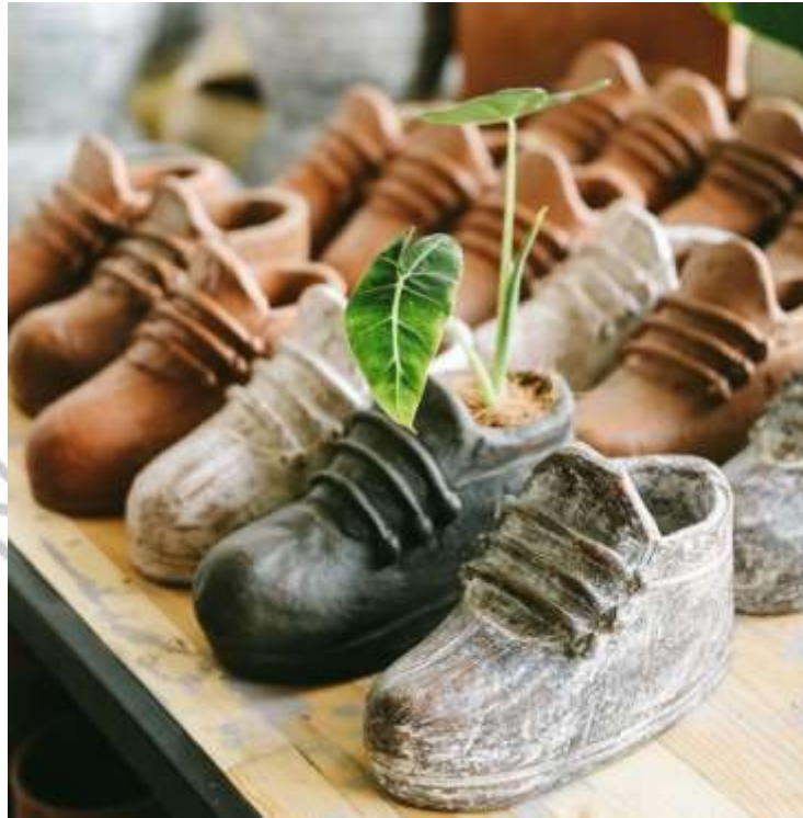
Gambar 2.18 Pot Sepatu