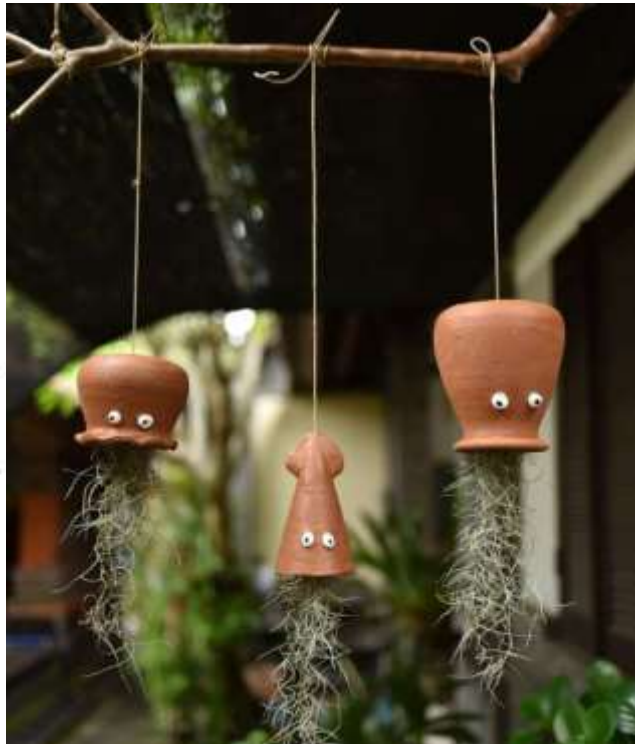
Gambar 2.10 Pot Gantung