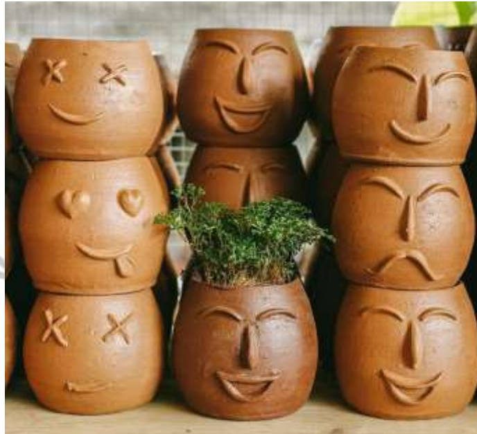
Gambar 2.6 Pot Emoji