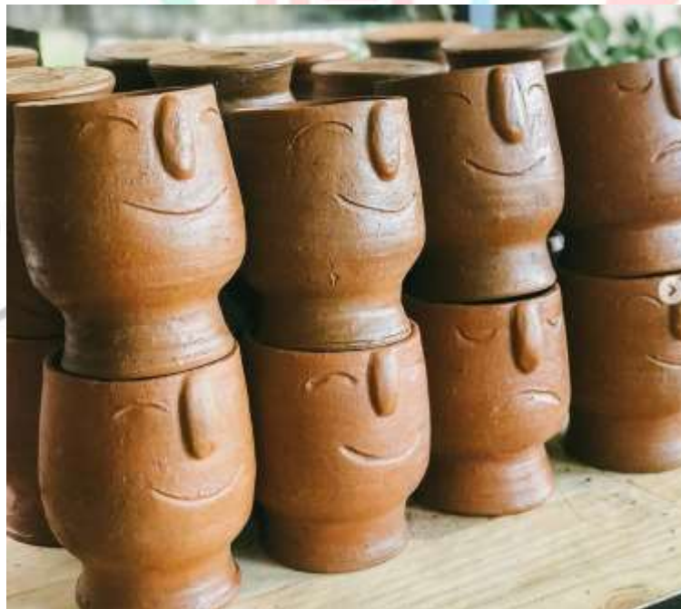
Gambar 2.19 Pot Wajah