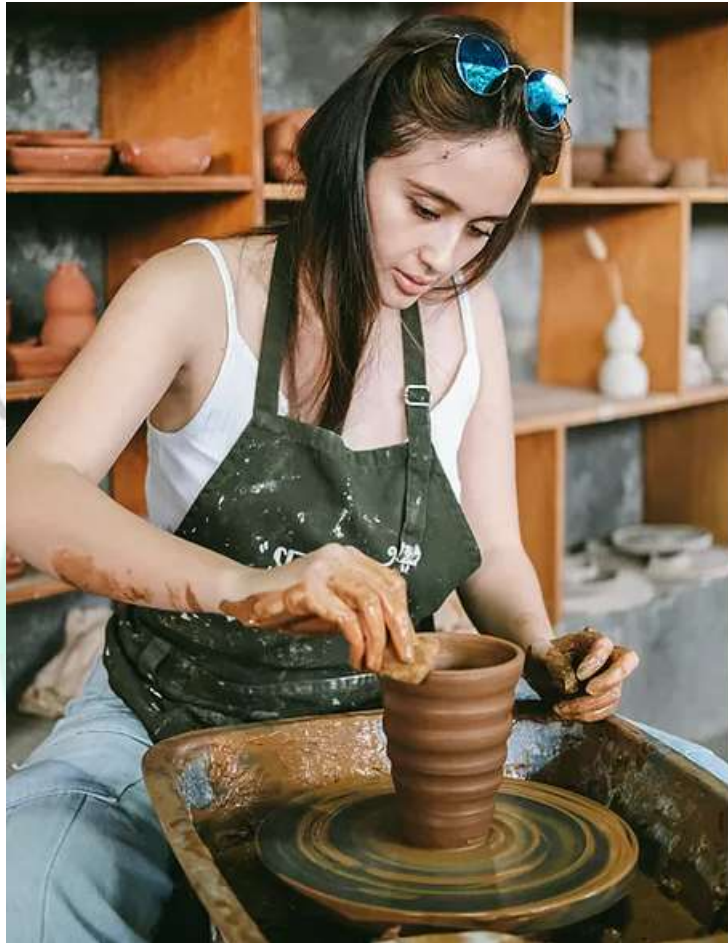
Gambar 2.5 Peserta Saat Workshop Pottery

Tidak hanya membuka kelas, Serayu juga menjual pot untuk tanaman dan juga dapat memesan sesuai keinginan pembeli, dalam proyek ini owner akan berdiskusi mengenai desain yang diinginkan oleh klien, setelah sepakat mengenai desain dan harga owner akan menjelaskan mengenai desain tadi kepada bagian produksi agar tidak terjadi kesalahan dalam pengerjaan.