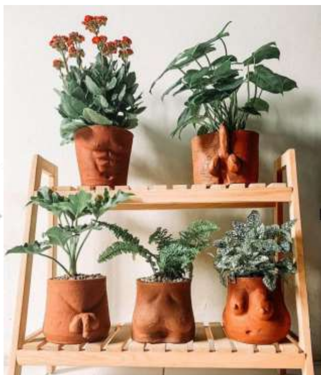
Gambar 2.8 Pot Bentuk Badan