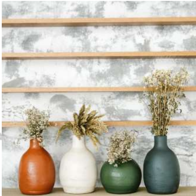
Gambar 2.12 Vase