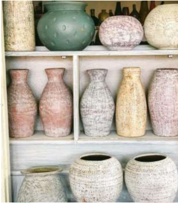
Gambar 2.14 Pot Rustic