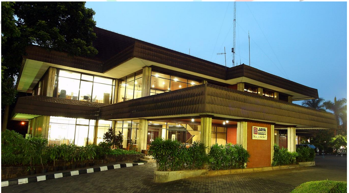
1.1.1 Gambar Gedung Kantor PT. Jaya Konstruksi

PT. Jaya Konstruksi adalah perusahaan yang masih bernaungan di dalam grup jaya, yang mana perusahaan ini bergerak di bidang infrastruktur tidak hanya itu saja instansi ini juga bergerak di bidang perdagangan asap, bakal bakar gas, lalu yang terakhir adalah pabrikasi beton. Perseroan sebelum mencatatkan sahamnya di bursa efek tahun 2007, merupakan divisi kontraktor di PT Pembangunan Jaya. Perusahaan terus meningkatkan ke ahlihan di bidangnya agar dapat bersaing dengan para pesaingnya Dengan memiliki pengalaman Perseroan yang kuat dalam memberikan solusi-solusi yang mempunyai nilai tambah, maka dengan itu memperkuat profilnya di sektor komersil dengan memberikan yang terbaik di setiap pengerjaannya.