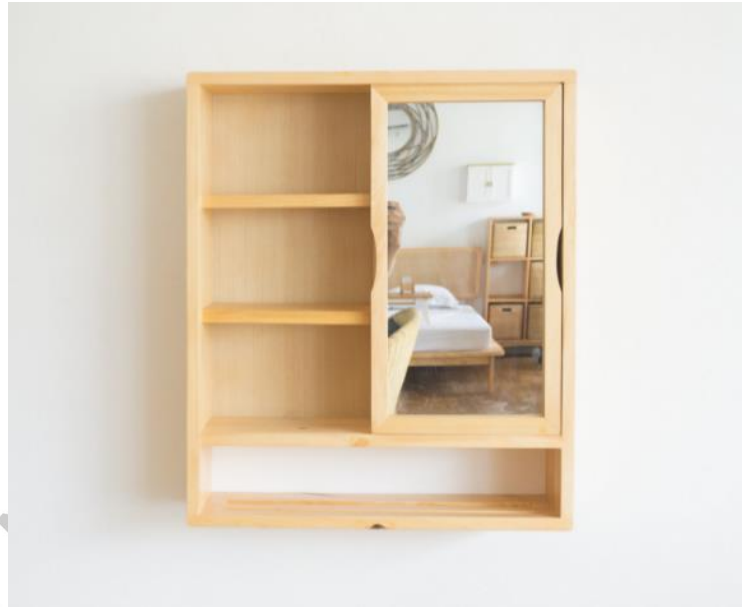
Gambar 2.6. Estu Vanity Mirror Natural