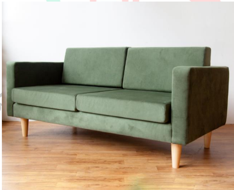
Gambar 2.5. Minima Sofa