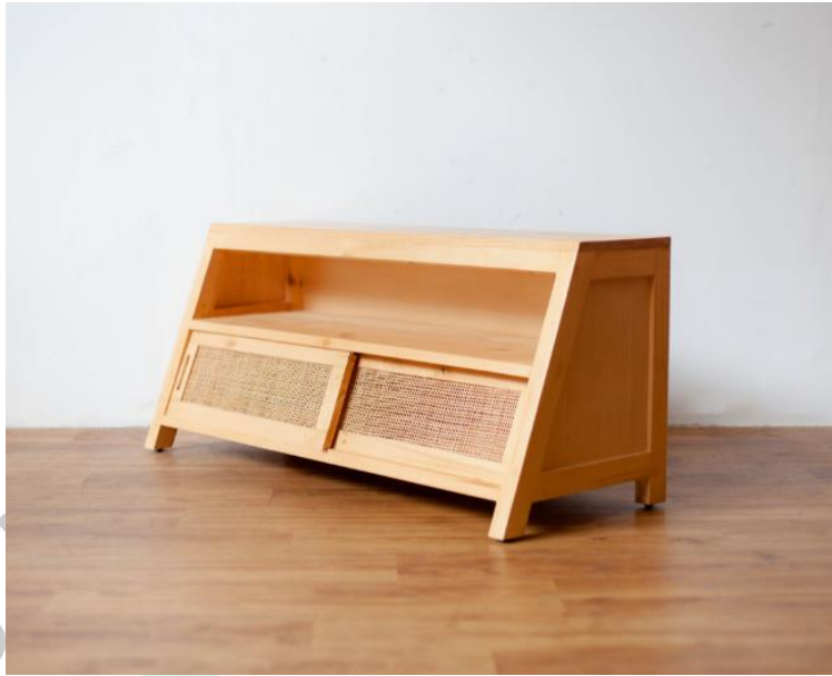
Gambar 2.4. Seजार Shoe Bench