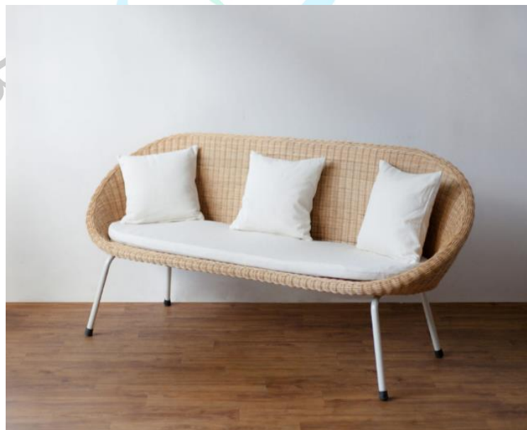
Gambar 2.3. Kagumi Chair 3 Seater White (Sumber : Dok. Uwitan)

Uwitan memproduksi furniture untuk interior rumah berbahan rotan dan pinus dengan menggunakan gaya desain minimalis bertema Jepang dan Korea. Berikut ini adalah contoh produk yang tersedia di Uwitan.