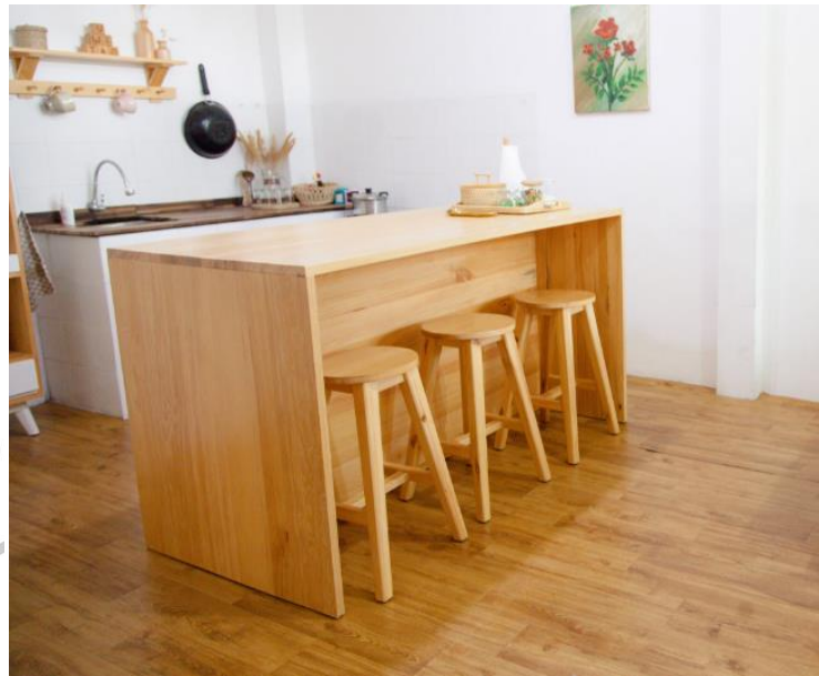
Gambar 2.7. Alana Island Table (Sumber : Dok. Uwitan)