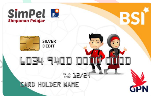
Gambar: 2.8 BSI Debit SimPel

-BSI Debit SimPel dikhususkan untuk tabungan pelajar mulai dari SD-SMA. Kartu ini juga mempunyai limit khusus yang disesuaikan dengan pelajar. Kartu BSI Debit SimPel memiliki limit khusus agar para Pelajar dapat bertransaksi dengan aman dan mudah. Kartu dapat dipergunakan oleh Pelajar di seluruh jaringan mesin EDC dan ATM manapun di Seluruh Indonesia (Nasional).