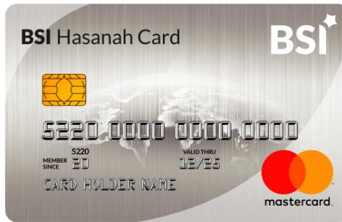
Gambar: 2.1 BSI Hasanah Card Classic