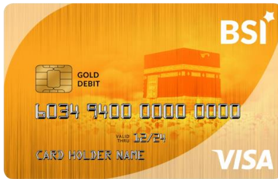
Gambar: 2.9 Haji BSI Visa