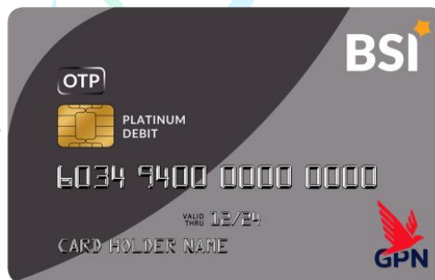
Gambar: 2.4 BSI Debit GPN

- BSI Debit GPN adalah sistem yang menggerakkan berbagai instrumen sistem transaksi serta membangun berdasarkan ketentuan dan mekanisme yang dibentuk untuk mendukung transaksi pembayaran secara nasional. kartu ATM BSI yang memiliki beberapa macam silver gold maupun platinum, dan masing masing memiliki limit yang berbeda, kartu silver memiliki limit rendah dan platinum memiliki limit tinggi.