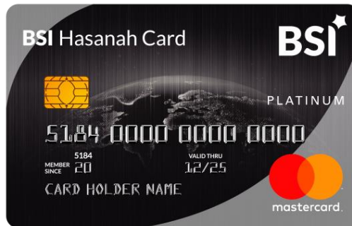
Gambar: 2.3 BSI Hasanah Card Premium

Rp 900 juta, Annual Membership Fee Rp 120 ribu & Monthly Fee Rp 800 ribu -Rp 18 juta Memiliki penghasilan minimum setahun Rp. 36 juta