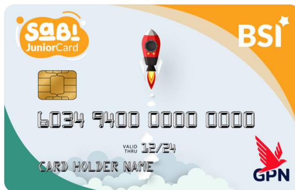
Gambar: 2.7 BSI Debit Sabi