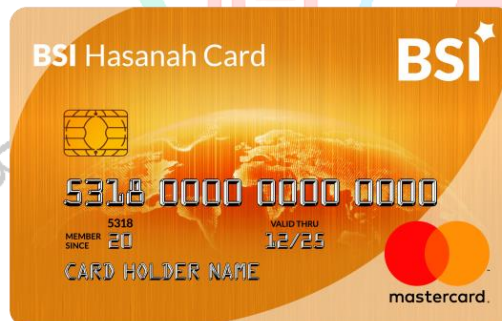
Gambar: 2.2 BSI Hasanah Card Gold