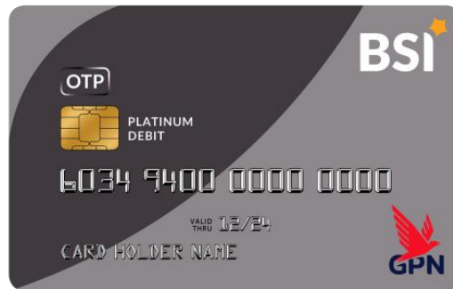
Gambar: 2.5 BSI Debit OTP