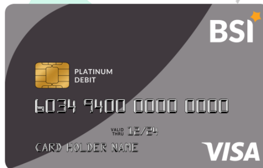
Gambar: 2.6 BSI Debit Visa

- BSI Debit Visa adalah produk Kartu Debit /ATM yang dikeluarkan oleh PT Bank Syariah Indonesia Tbk dengan menggunakan logo Visa Worldwide yang bisa dipergunakan oleh Nasabah di seluruh jaringan EDC dan ATM manapun di seluruh dunia (Internasional).ATM yang dapat digunakan pada jaringan internasional maupun lokal.