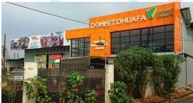
2.1 Gambar DMC Dompot Dhuafa

Disaster Management Center sebuah Lembaga semi otonom Dompot Dhuafa yang menjadi garda terdepan dalam pengelolaan kebencanaan baik di dalam maupun luar negeri, pada masa pra bencana, saat bencana & pasca bencana. Disaster Management Center (DMC-DD) sebuah Lembaga pelaksanaan