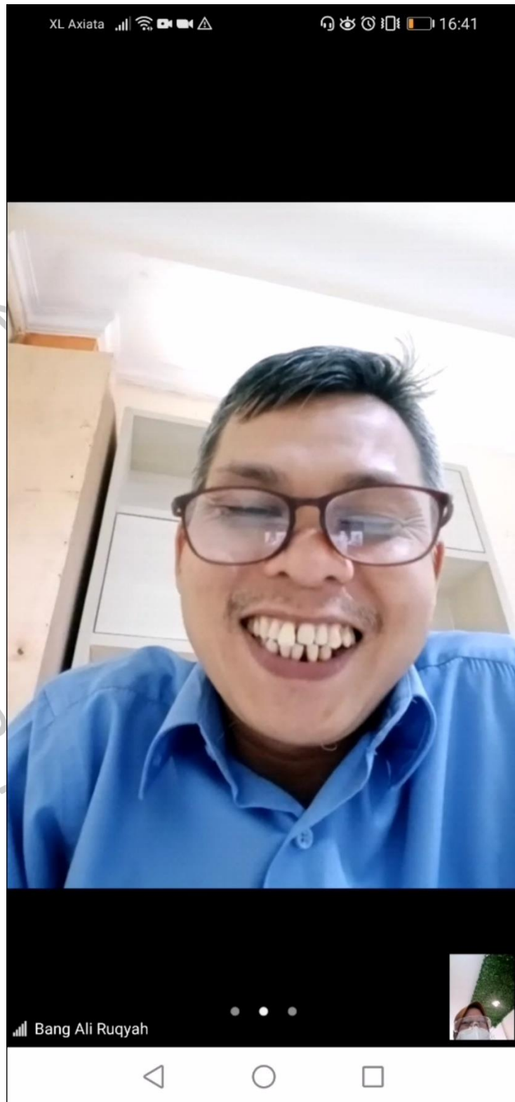
Lampiran 2.2. Praktikan Saat Melakukan Bimbingan Dengan Pembimbing Kerja dan Rapat Mingguan Bersama Tim Beserta Rekan Kerja