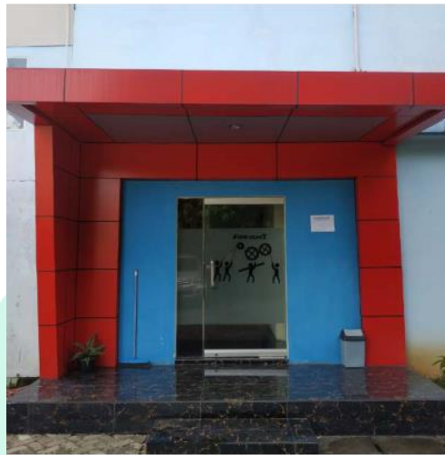
Gambar 2.2 Foto Kantor Utama PT Rekayasa Teknik Perdana

PT Rekayasa Teknik Perdana juga dapat melakukan pekerjaan pelayanan berupa pekerjaan produk seperti perizinan yang berkaitan dengan proses pendirian tower telekomunikasi sampai menara tersebut sudah berdiri. Produk dokumen tersebut meliputi SIS atau Pra-Sitac, SITAC, IMB, CME Dan PLN.