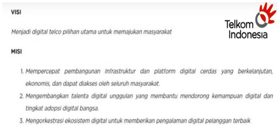
Gambar 2. 2 Visi dan Misi PT Telkom Indonesia