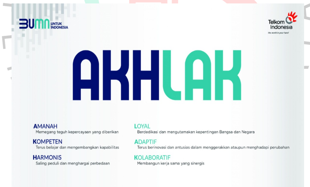
Gambar 2. 3 Core Value PT Telkom Indonesia