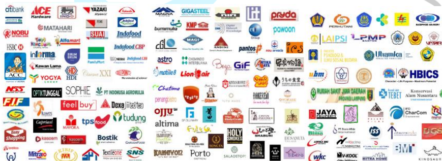
Gambar 2.2 Rekan Kerja dan Klien Fonbright Indonesia

Rekan kerja dan klien yang telah melakukan kerja sama dengan Fonbright Indonesia terdapat lebih dari 100 perusahaan yang berasal dari berbagai bidang. Perkembangan kerja sama Fonbright Indonesia dengan berbagai jenis perusahaan dimulai sejak tahun 2007. Perusahaan yang bekerjasama dengan Fonbright Indonesia berasal dari perusahaan lokal hingga multinasional dalam beragam jenis industri. Tidak hanya perusahaan, Fonbright Indonesia juga bekerja sama dengan sejumlah universitas dan rumah sakit yang bergerak di Indonesia, seperti Universitas Bunda Mulia, Rumah Sakit Jiwa Daerah Lampung, dan lain sebagainya. Gambar 2.2 di bawah ini menunjukkan sejumlah rekan kerja dan klien yang bekerjasama dengan Fonbright Indonesia dari masa ke masa.