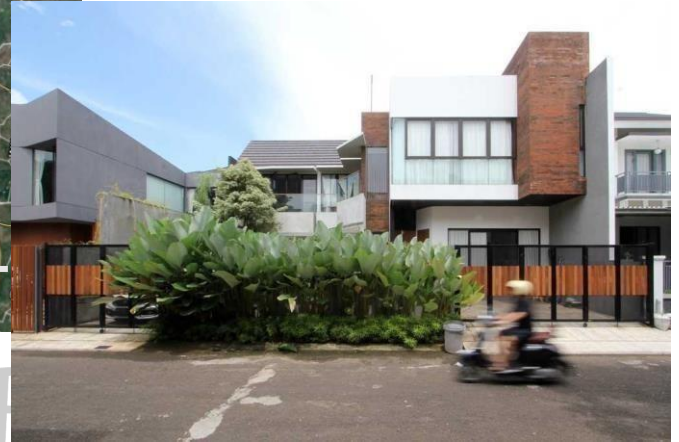
Gambar 3.2.1 Lokasi DAK House