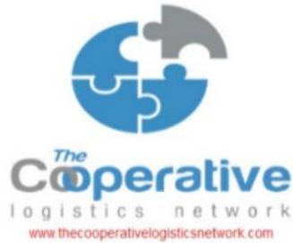
Gambar 2. 3 Logo The Cooperative Logistics Network

PT. Solid Global Solutions dioperasikan dan didukung oleh para profesional yang memiliki pengalaman, terlatih, terdidik di bidang pengiriman barang dan industri logistik, memegang sertifikat dari tingkat dasar hingga lanjutan. Tim layanan PT. Solid Global Solution hadir untuk memberikan solusi pada: