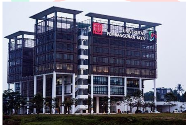
Gambar 2.1 Universitas Pembangunan Jaya

Universitas Pembangunan Jaya (UPJ) merupakan institusi pendidikan swasta yang didirikan tahun 2011 dan mendapat dukungan dari Grup Usaha Pembangunan Jaya. Sudah lebih dari 50 tahun sektor usaha dikelola dengan baik oleh Grup Usaha Pembangunan Jaya, bersamaan dengan adanya faktor tersebut Grup Usaha Pembangunan Jaya berniat menyisihkan sebagian dari kegiatan usaha utamanya, ke bidang pendidikan dengan maksud serta tujuannya untuk menciptakan dan mengembangkan sumber daya manusia yang berkompeten dan berkualitas.