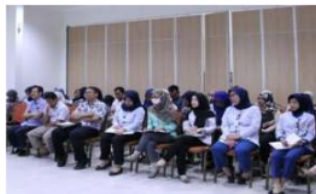
Gambar 3. Seminar diikuti oleh karyawan RS Permata Pamulang