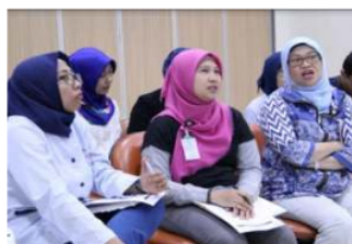
Gambar 4. Peserta dalam Diskusi Interaktif