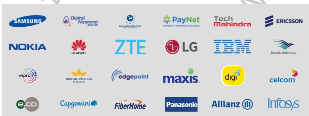
Gambar 2.2 Client Perusahaan Hexa Business