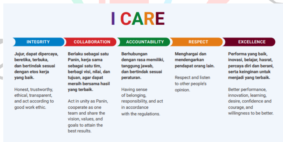
Gambar 2.2 Budaya Perusahaan (PT Bank Panin, Tbk).