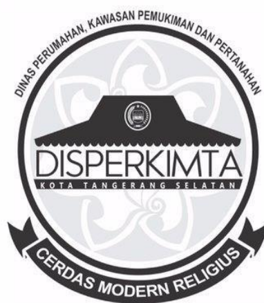
Gambar 1.2 Logo DISPERKIMTA

DISPERKIMTA yang memiliki singkatan dari Dinas Perumahan, Kawasan Permukiman dan Pertanahan Kota Tangerang Selatan. Pada Bidang Perumahan dan Permukiman memiliki tujuan untuk menata ruang dan infrastruktur, tujuan dari pembangunan infrastruktur perumahan dan permukiman adalah merencanakan infrastruktur perumahan dan permukiman, atas dasar kerangka penataan ruang wilayah, yang telah direncanakan sebelumnya, bisa sesuai dengan yang sudah direncanakan, sehingga bisa bermanfaat sesuai dengan kebutuhan dan ketentuan perundang-undangan yang telah berlaku. Tujuan ini tidak akan tercapai apabila tidak dilakukan perubahan dalam pengelolaan tanah, seperti pendaftaran, sertifikasi, pembebasan tanah, ganti rugi, pemberian hak atas tanah dan lain-lain.