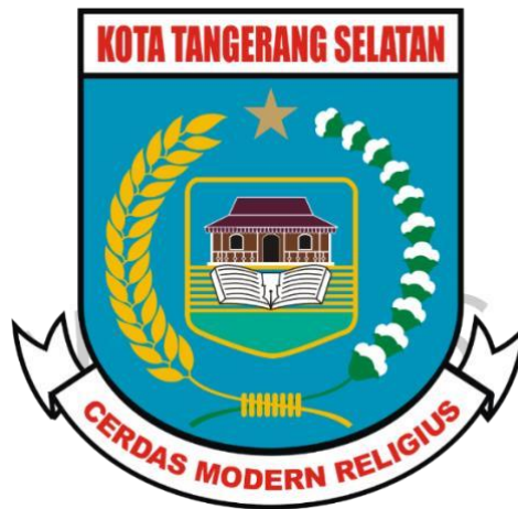
Gambar 1.1 Logo Simbol Tangerang Selatan