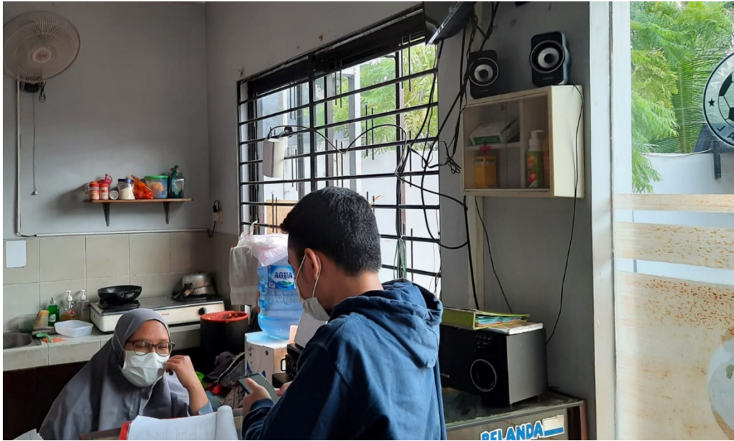
Lampiran 3 Wawancara Dengan Pengelola Lapangan Futsal