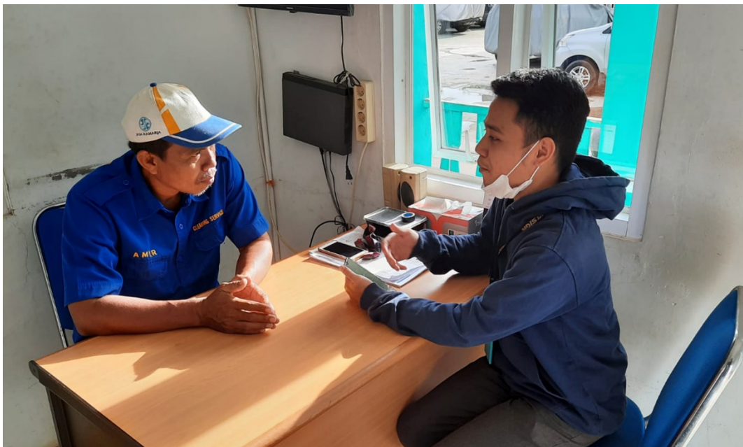
Lampiran 4 Wawancara Dengan Pengelola Lapangan Bulu Tangkis