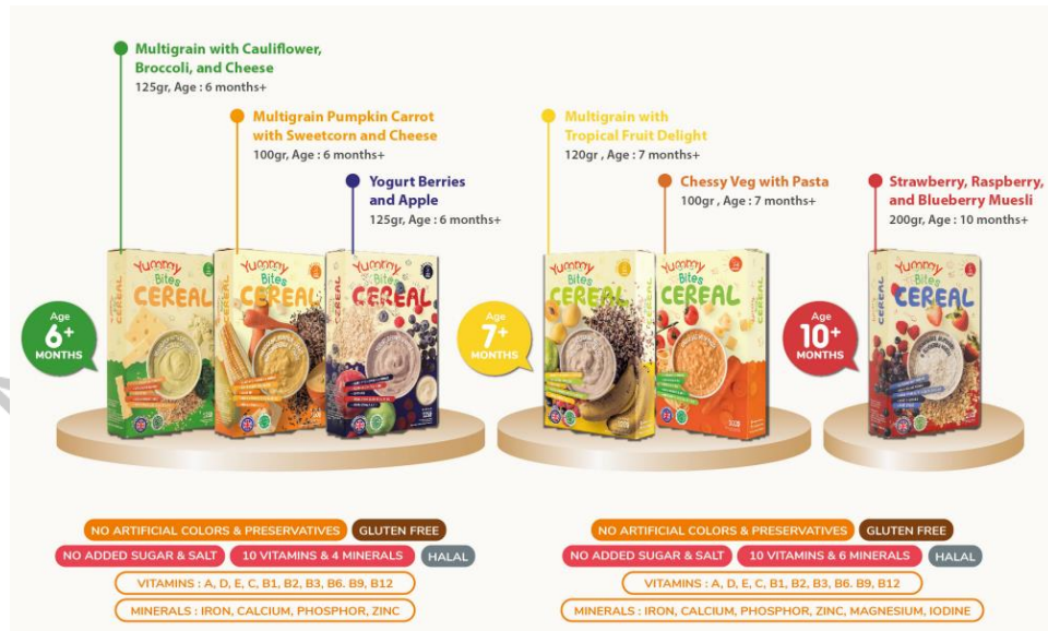
Gambar 2.7 Yummy Bites Cereal