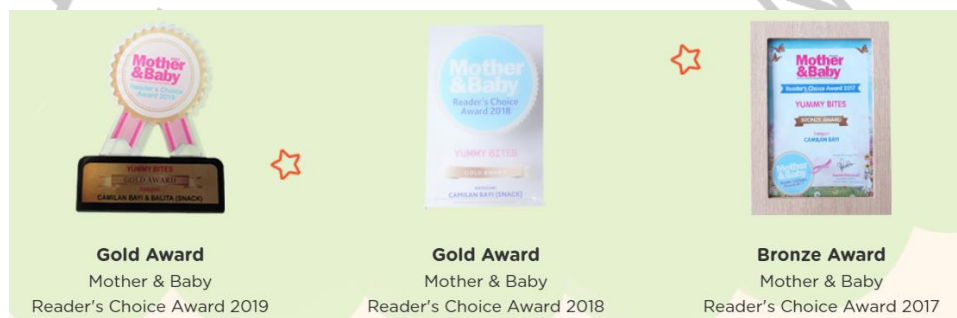
Gambar 2.8 Penghargaan yang diperoleh PT Leon Boga Sentosa