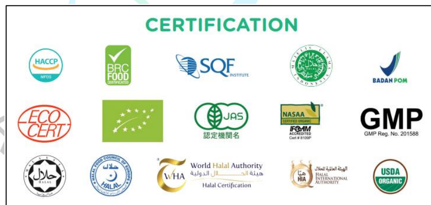
Gambar 2.2 Sertifikasi Produk Yummy Bites

Yummy Bites hadir sejak tahun 2015 dengan berbagai makanan utama dan selingan bagi Si Kecil dengan kualitas terbaik, berbahan dasar alami, organik dan tanpa pengawet. Produk Yummy Bites aman dikonsumsi karena telah melalui proses sertifikasi standar keamanan pangan internasional dan mendapatkan sertifikat seperti sertifikat HACCP ( Hazard Analysis and Critical Control Points ), BRC ( British Retail Consortium ), SQF ( Safe Quality Food ), dan oleh badan sertifikasi untuk produk organik seperti USDA (USA), NASAA (Australia), JAS (Jepang), dan ECOCERT (Prancis). Sertifikasi ini menjamin kualitas kontrol untuk kebersihan serta keamanan produk dari Yummy Bites . Berikut ini adalah daftar sertifikasi yang didapat oleh Yummy Bites :