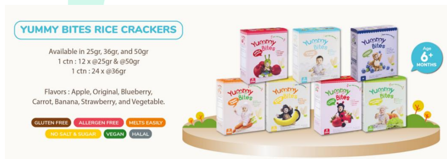
Gambar 2.5 Yummy Bites Rice Crackers