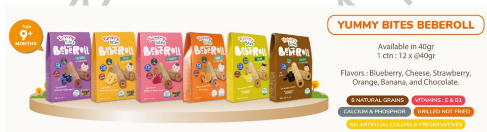
Gambar 2.6 Yummy Bites Beberoll