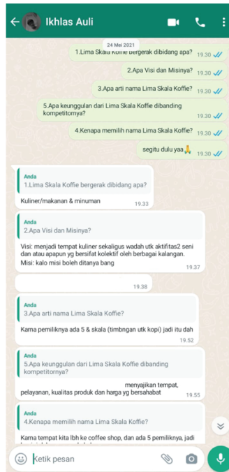
Lampiran 1. 1 Wawancara Pihak Lima Skala Koffie