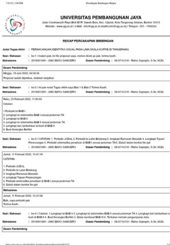
Lampiran 1. 4 Percakapan Bimbingan Halaman 1