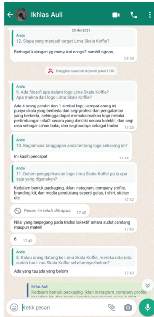
Lampiran 1. 3 Wawancara Pihak Lima Skala Koffie