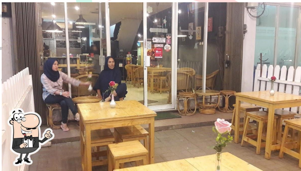
Gambar 1.3 Suasana Jam Operasional Libra Pool & Coffee