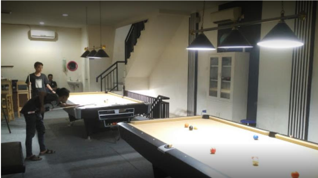
Gambar 1.5 Fasilitas Billiard Libra Pool & Coffee