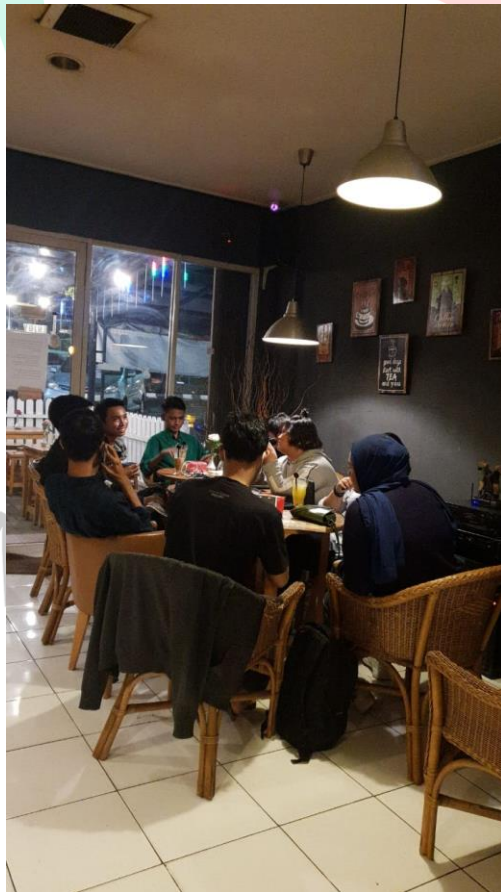
Gambar 1.6 Suasana Umum Libra Pool & Coffee