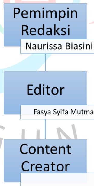
Gambar 2.3 Struktur Organisasi Media Kompas