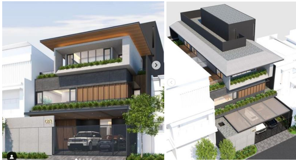
Gambar 2. 2 HS House (Intagram, 2022)