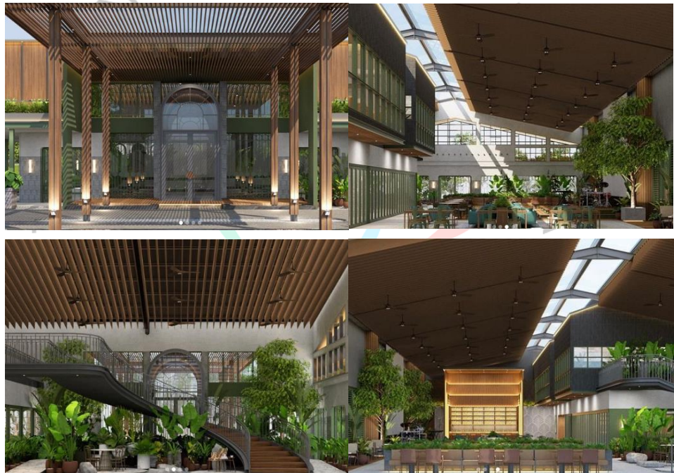
Gambar 2. 3 OCBD Café (Intagram,2022)

HS House dan OCBD Café adalah contoh dari kegiatan-kegiatan yang dilakukan oleh sidharta architect. Pada proyek ini perusahaan mengerjakan proses pembuatan 3D maupun detail detail lainnya. Proyek OCBD Cafe dikerjakan bersama tim dikarenakan luas bangunan yang cukup besar dan banyaknya permintaan dari klien membuat proyek ini butuh pengerjaan Bersama tim sedangkan pada proyek HS dikerjakan oleh perorangan agar dalam mendesain lebih fokus dan identik dengan arsitek yang membuat.