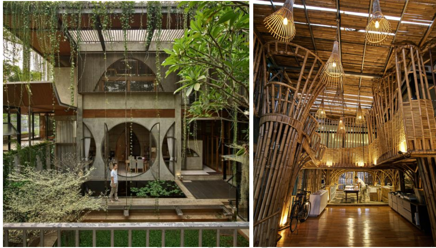
Gambar 2.1. 2 Kantor Realrich Architecture Workshop