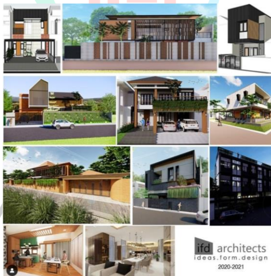
Gambar 2.2 Proyek-proyek dari Instansi

IFD architects adalah sebuah konsultan yang fokus pada desain arsitektur dan juga desain interior. IFD adalah singkatan dari Ideas Form Design, yang merupakan gambaran proses kami dalam mendesain. Resmi dimulai pada 1 Februari 2013. Pendiri perusahaan desain ini adalah Imron Yusuf dan Nurfitri Mahdarina sekaligus sebagai principal arsitek di dalam instansi tersebut.