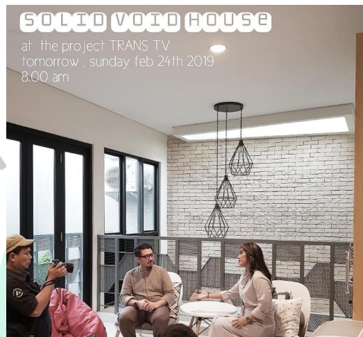
Gambar 2. 3 Proyek yang diliput media televisi

dalam tahap mendesain atau sekedar mengikuti sayembara atau kompetisi. Adapun Beberapa proyek diantaranya telah diliput dari media lokal maupun internasional.